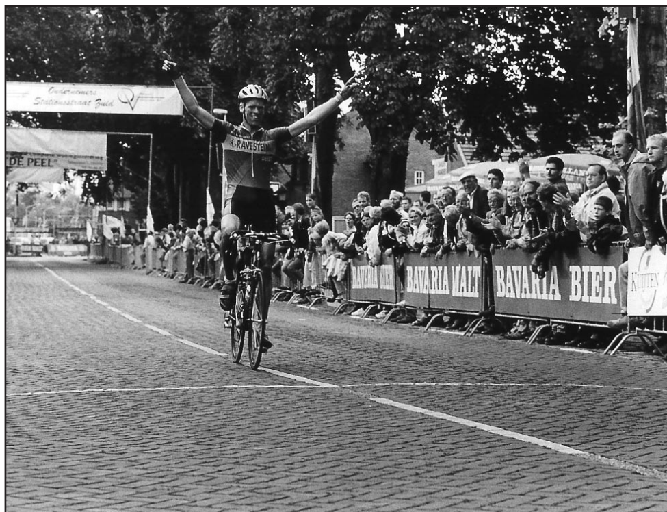
Een van de laatste Omlopen van Groot-Deurne